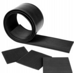
ورقه لاستیکی آجدار